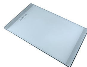
Tagliere in cristallo 8631 300